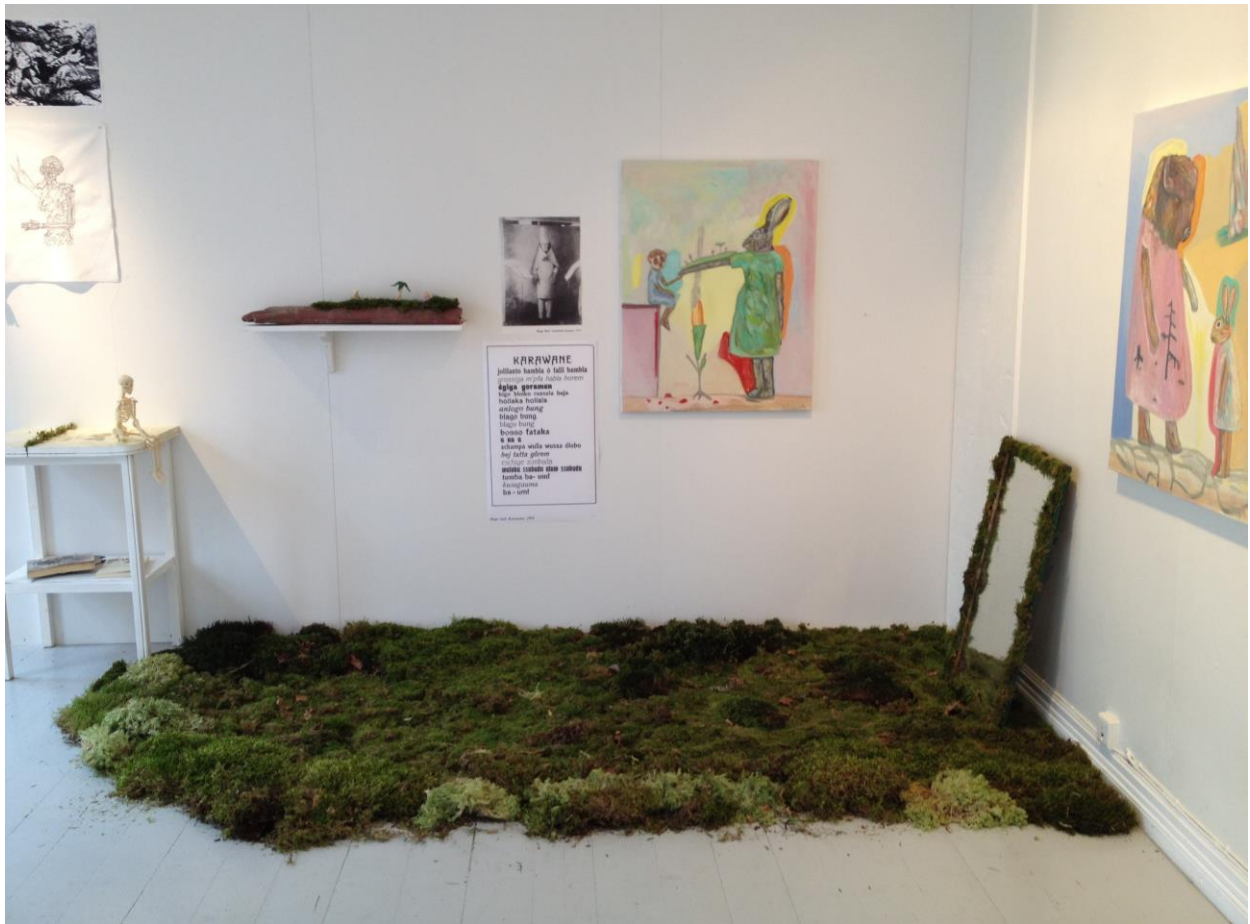
Om hundre år er allting glemt ©Astrid Mørland/ BONO 2017