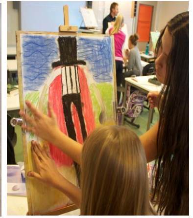
En helt surrealistisk opplevelse © Jacek Karłowicz