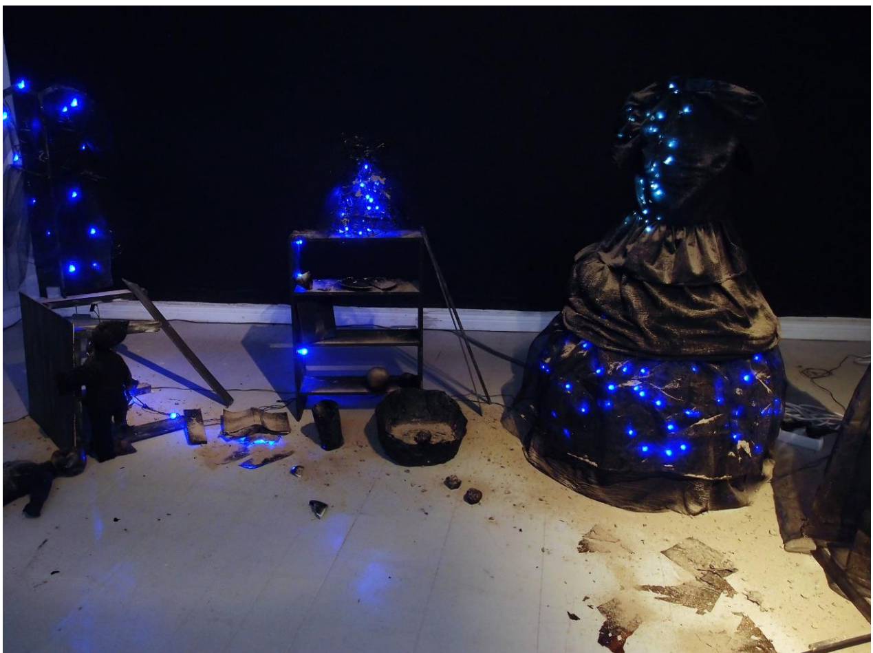
Dark room på utstillingen Om hundre år er allting glemt ©Astrid Mørland/ BONO 2017