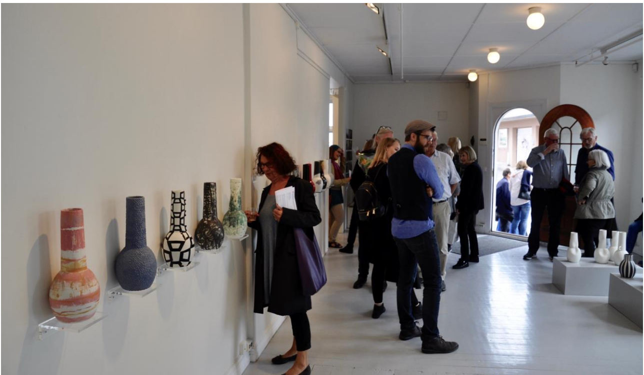
Åpning av utstillingen ..Same, same, but different...