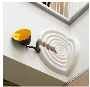
©Marilyn A Owens ©Tanja Thorjussen ©Martine Linge. Fagerli skole, Larvik. Foto: Bjørn Harstad