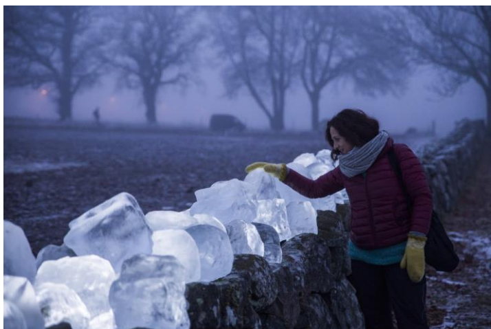
Isinstallasjon © Randi Beck 2017