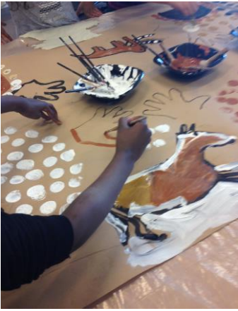
Hvordan male en mammut © Hanne Marwold Clarke