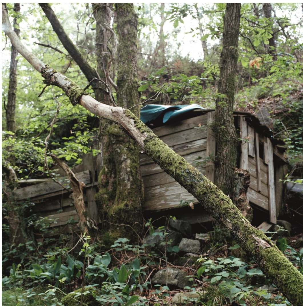
Moss on a broken tree