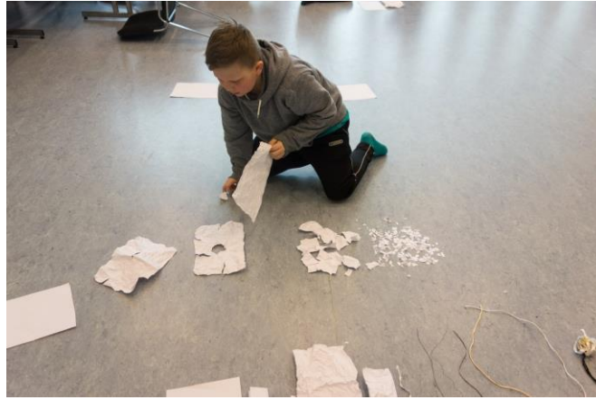
Kontraster © Lena Sjøberg