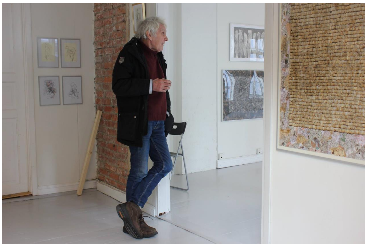
Montering av utstillingen Yeap © Jan Radlgruber