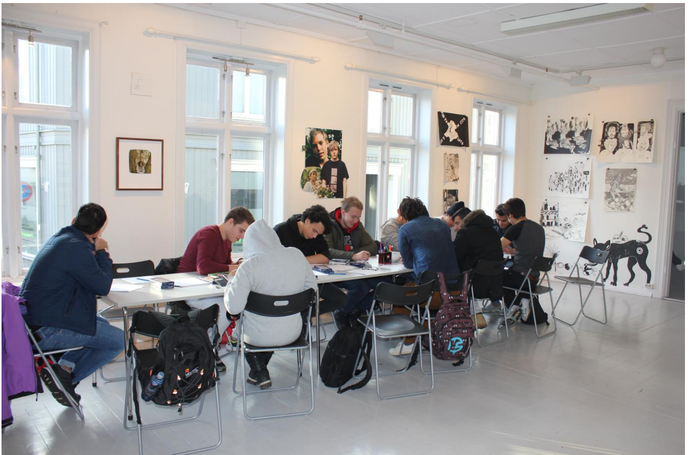
Elever fra Færder videregående skole på formidling av TRANSITIONS