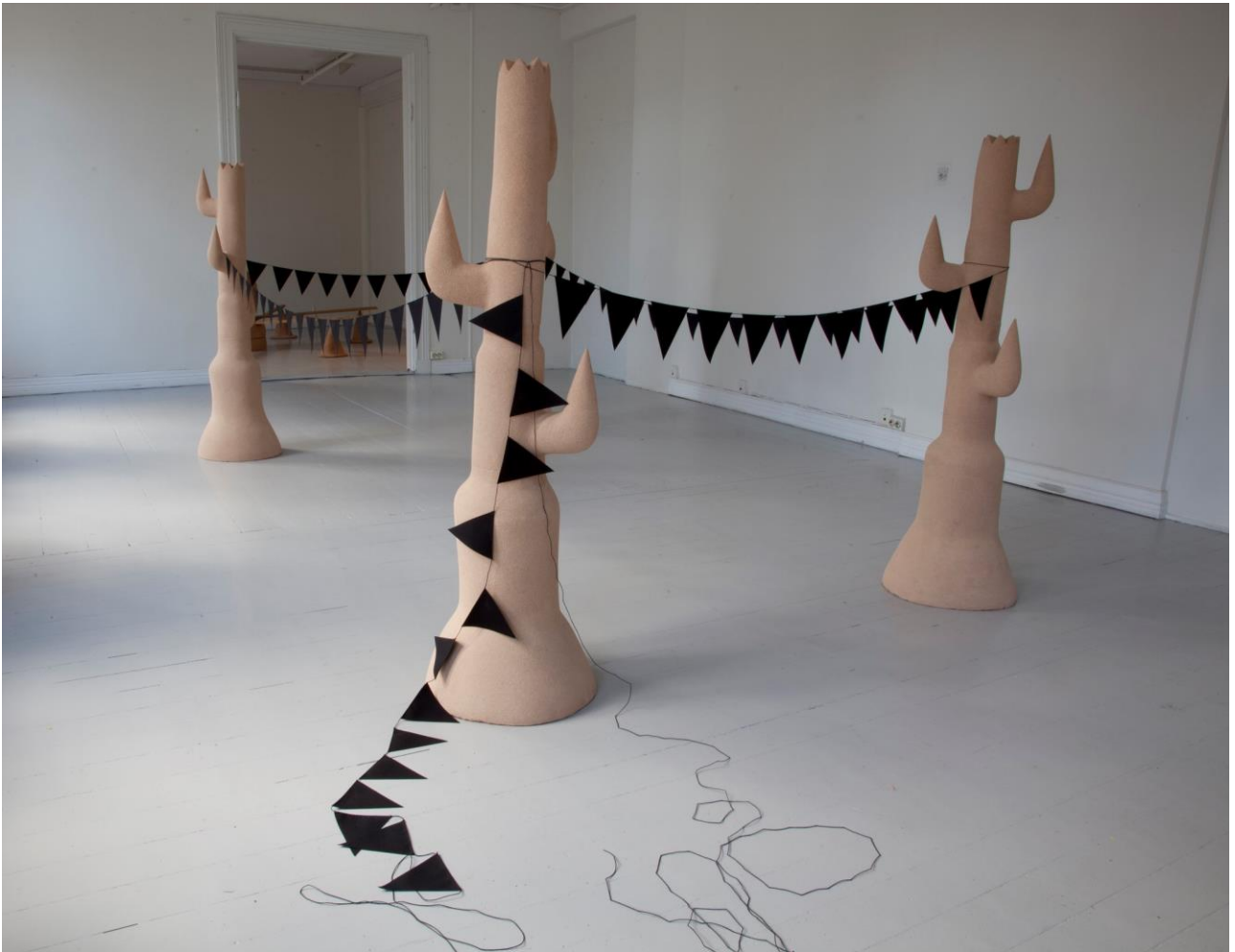
Treason Season © Øyvind Suul/BONO 2017. Foto: Øyvind Suul