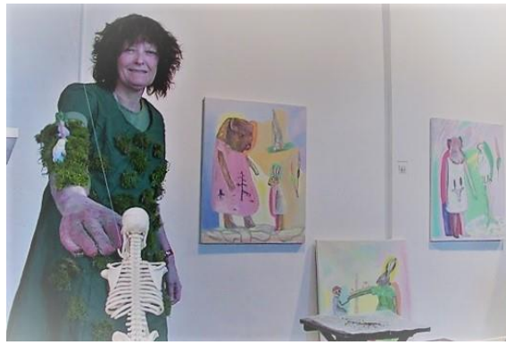
Om hundre år er allting glemt ©Astrid Mørland/BONO2017. Fra performance Mose,mose,mose