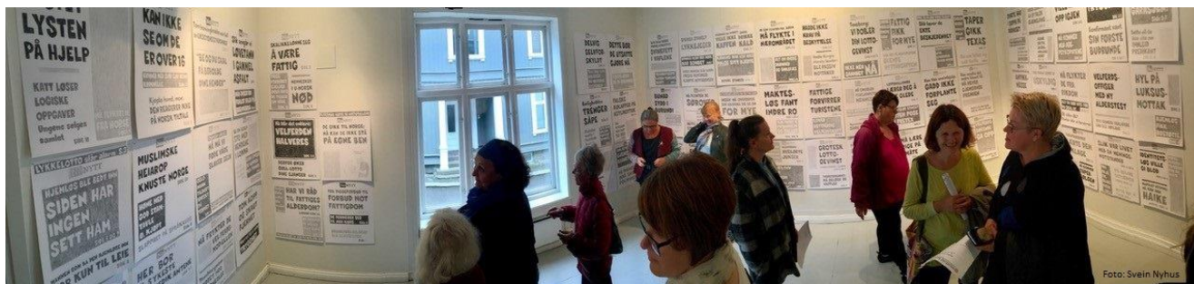
NoNews ©Morten Nyhus 2017