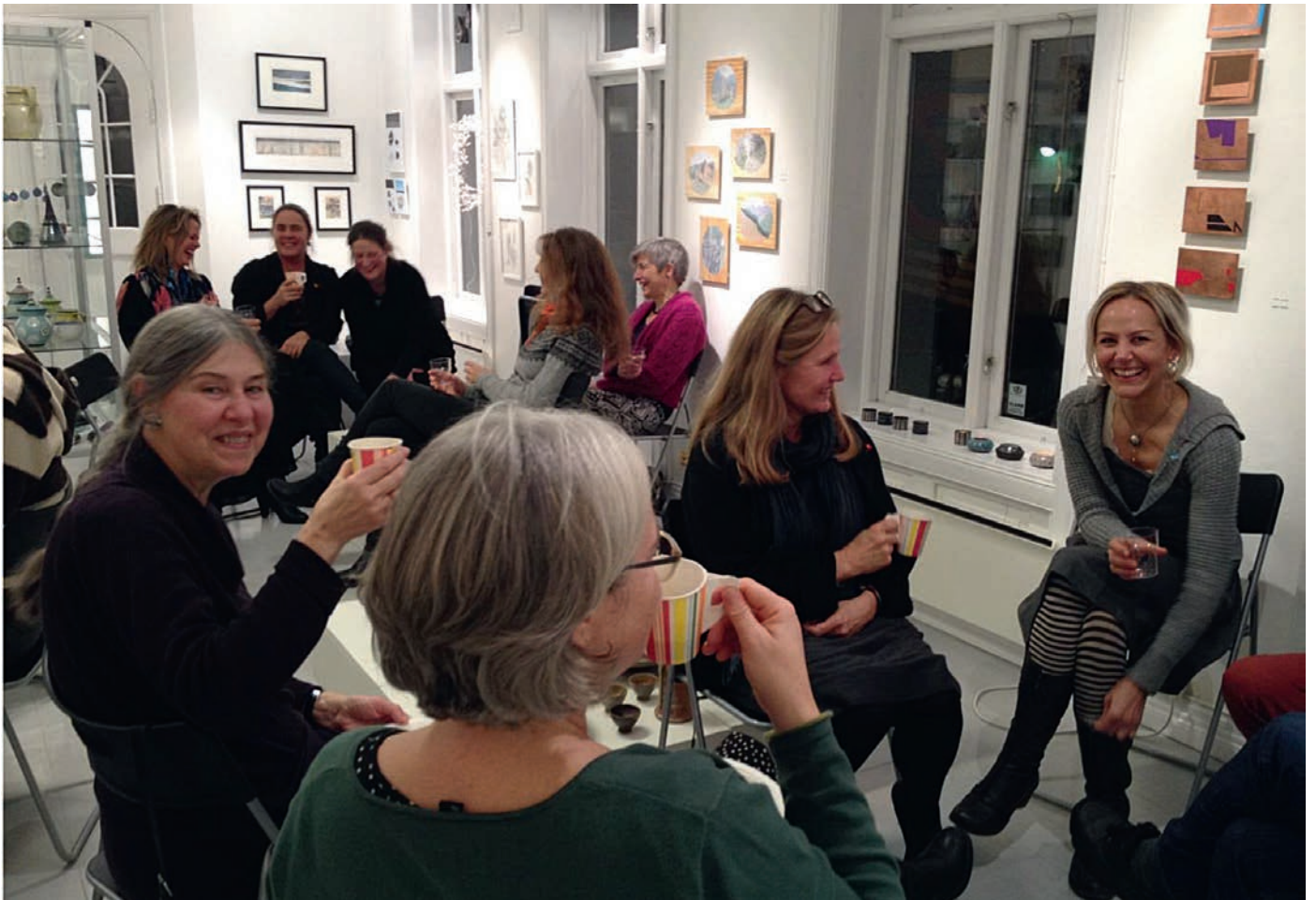
God stemning på «Firmafesten 2014» Kunstsenterets årlige juleavslutning.