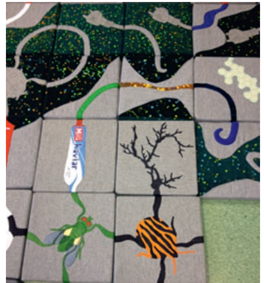
Puslespillet, utsnitt