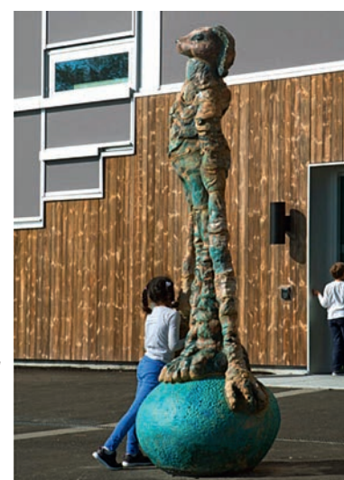
Eggevokter ©Irene Nordli/BONO 2014