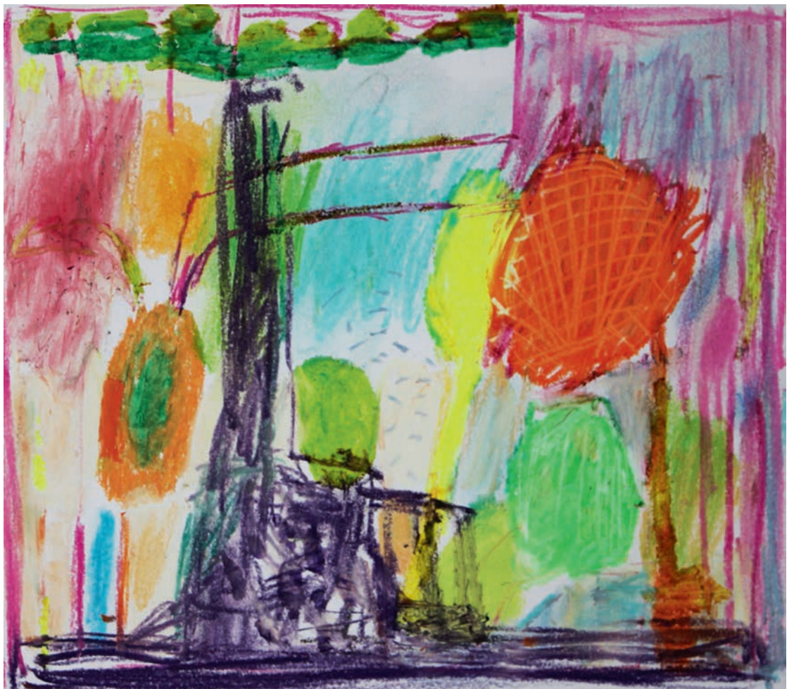
Pastell. ©Ellen Rishovd Karlowicz