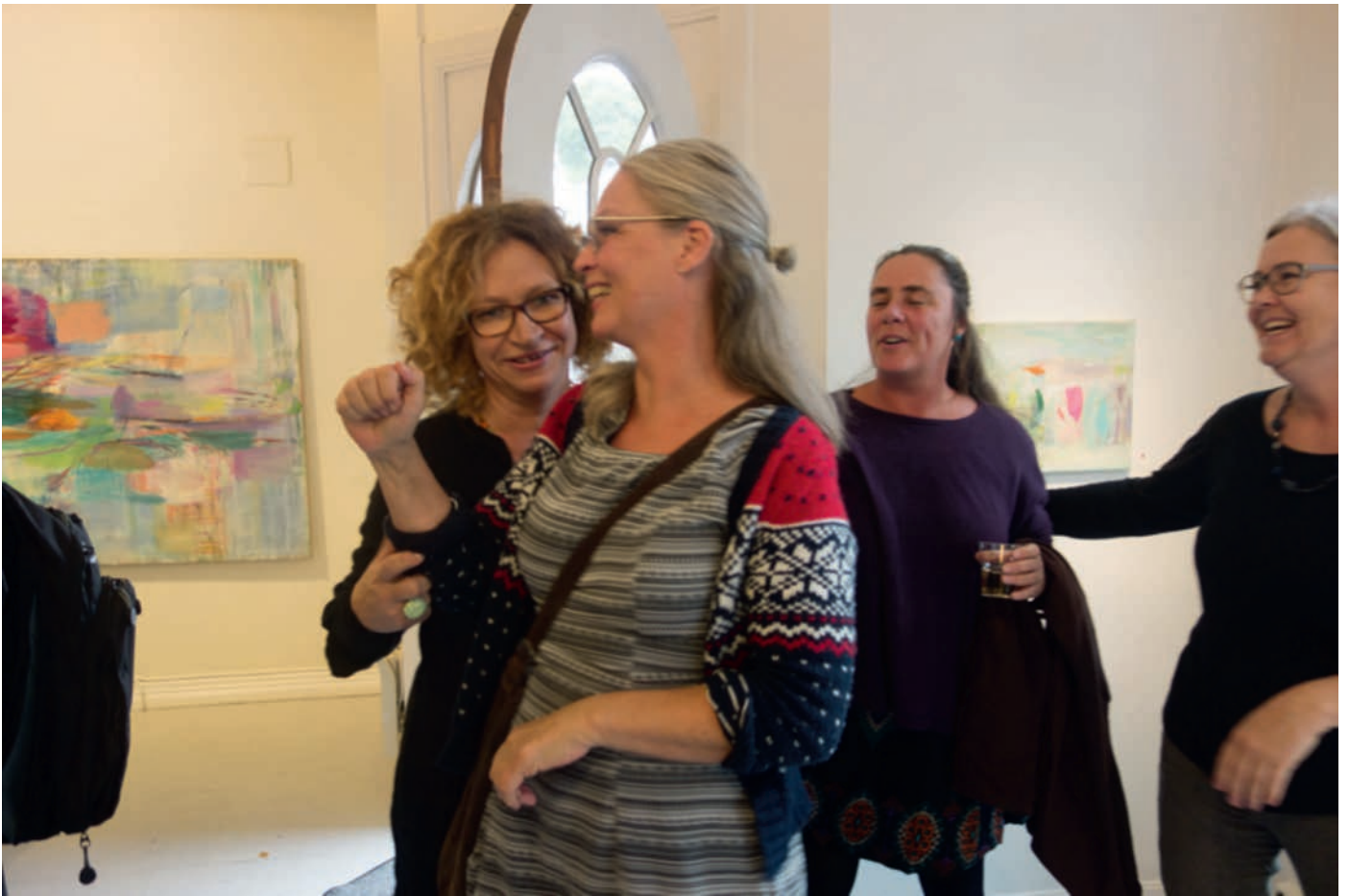
Damer i farta!