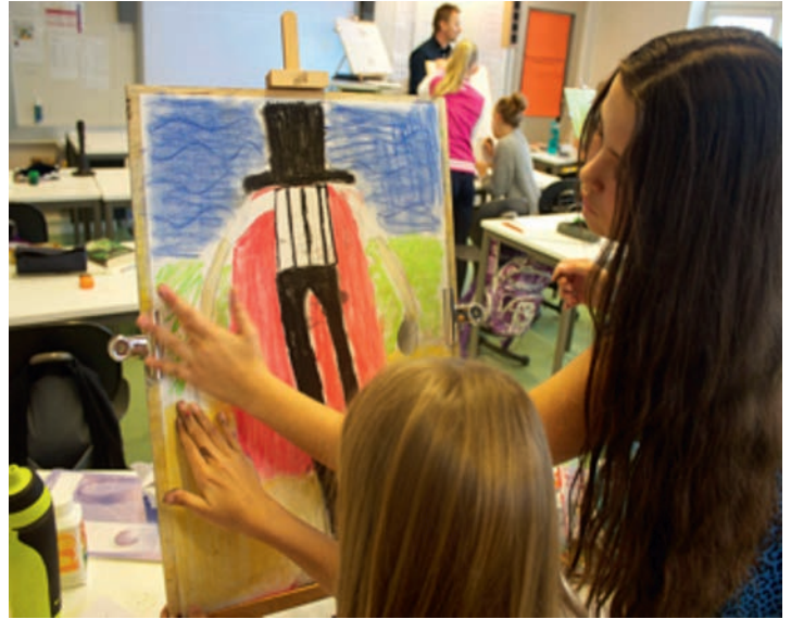
Workshop, En helt surrealistisk opplevelse.

© May Snevold von Krogh, Med hud som lerret.