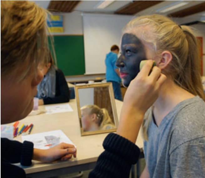
Elever maler ansikter

© May Snevold von Krogh, Med hud som lerret.