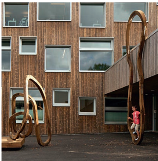
U.T © Erlend Leirdal/BONO 2014