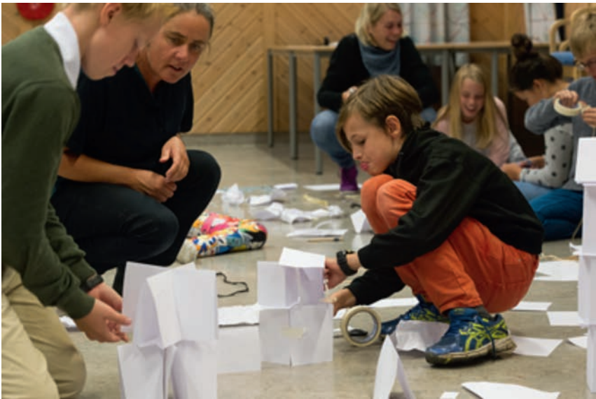
© Lena Søeborg formidler «Kontraster» i Nordland fylke.