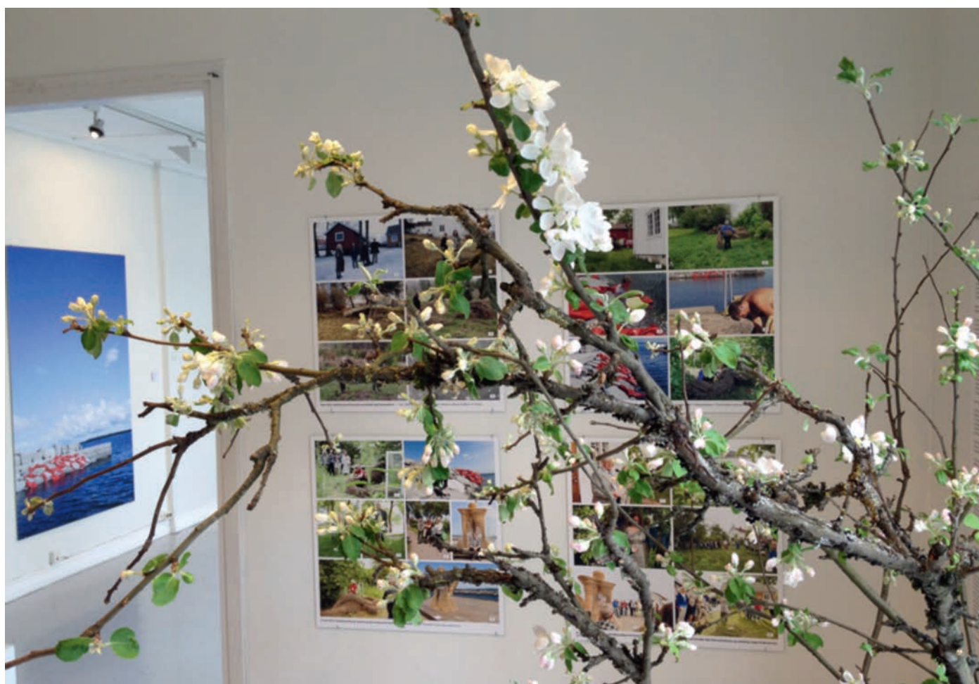
En liten bit av Åsgårdstrand i Kunstsenteret – fra «Måneskinntien i retrospekt» våren 2014