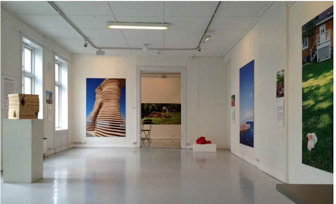
Fra dokumentasjonsutstillingen «Måneskinnstien 2013 i retrospekt» våren 2014 – Temporært stedsspesifikt prosjekt.